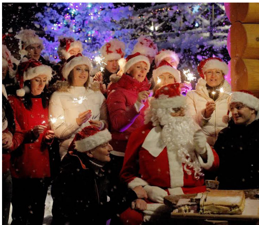
Čarobnost, prazničnost, toplina – takole prijetno je bilo tisto nedeljo na snemanju.

Zelena vas Ruševca na Hočkem Pohorju je bila 'destinacija', ki so